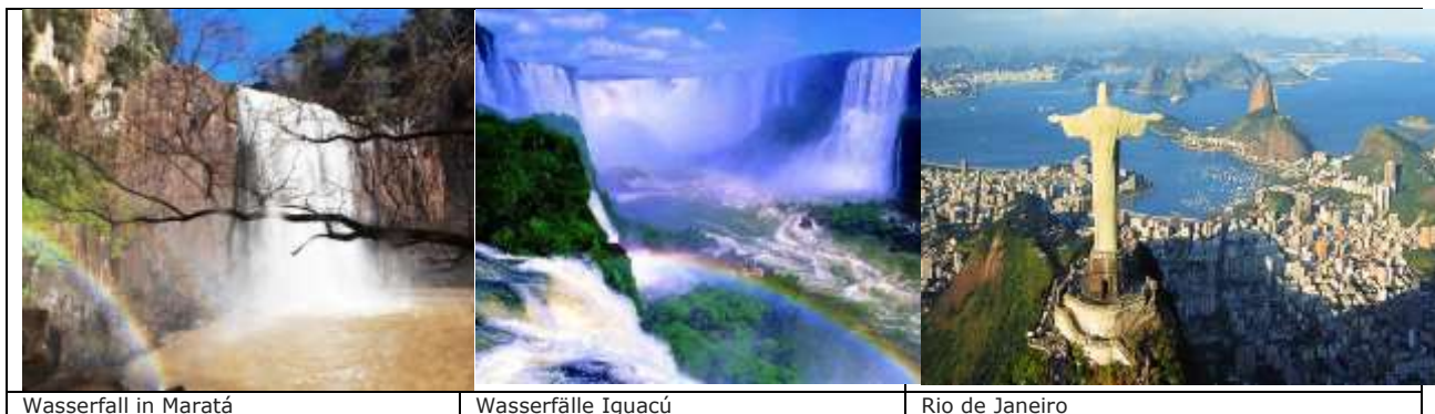
Wasserfall in Maratá