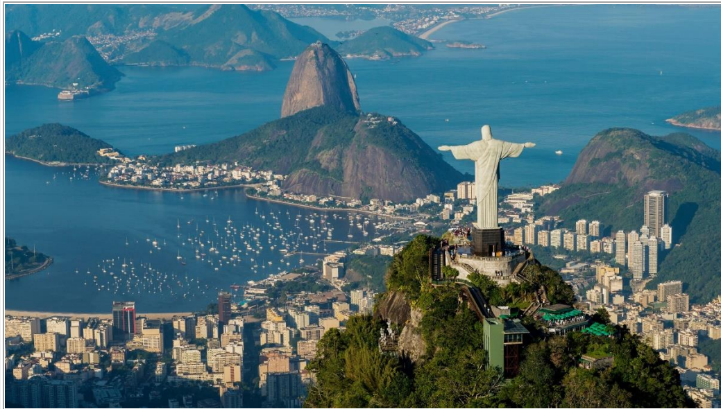
Rio de Janeiro mit Corcovado (Christusfigur auf dem Berg)