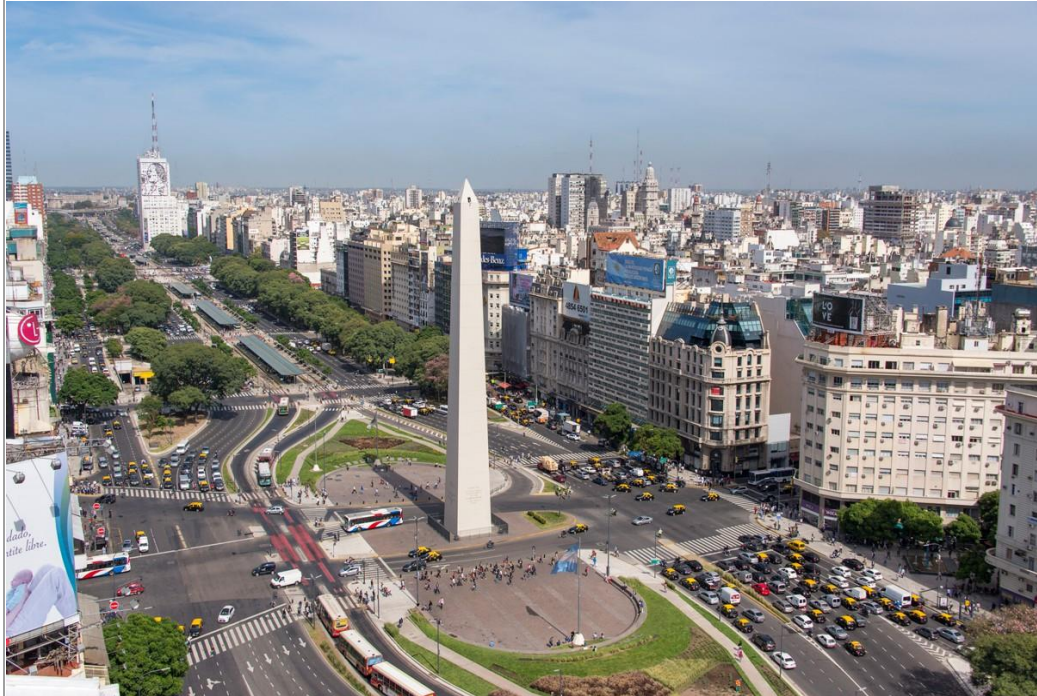
Buenos Aires – Hauptstadt von Argentinien

teuersten Wohngegenden – im 19. Jahrhundert siedelte sich hier die Oberschicht an und errichtete große, prächtige Villen. Am besten macht man einen kleinen Spaziergang durch das Viertel und geht danach direkt zum Friedhof. Er ist sehr schön angelegt und zudem letzte Ruhestätte der berühmtesten Persönlichkeiten des Landes u.a. „Evita“.